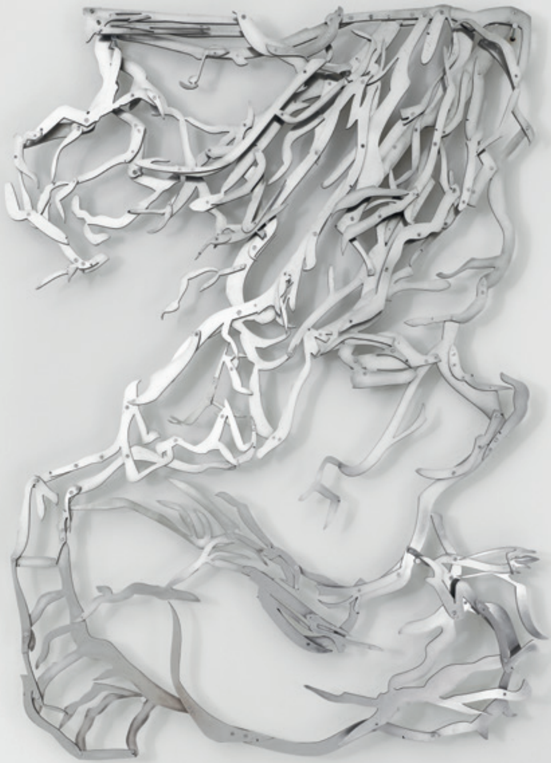
Hängender Baum, 2014, Aluminium, 172 x 127 x 8 cm