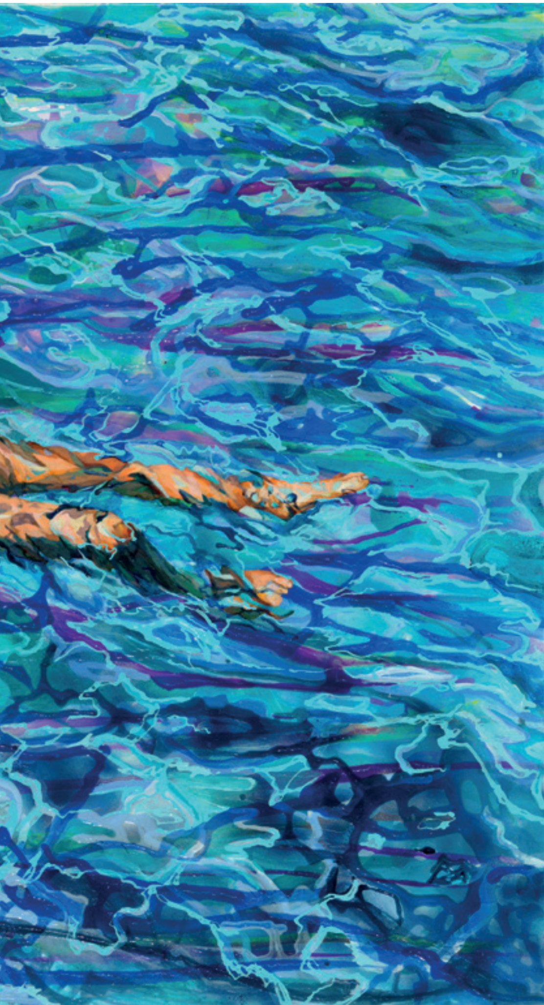
Air Liquide, 2013, Acryl, Papiercollage auf Leinwand, 140 x 190 cm