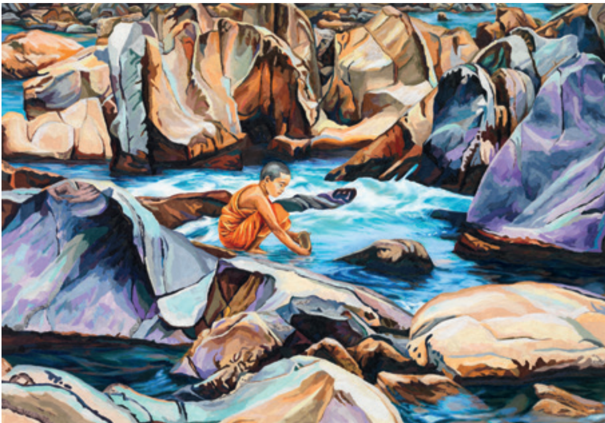
Zeitpunkt I, 2014, Acryl, Papiercollage auf Leinwand, 140 x 300 cm Ohne Titel, 2009, Acryl, Papiercollage auf Leinwand, 90 x 130 cm