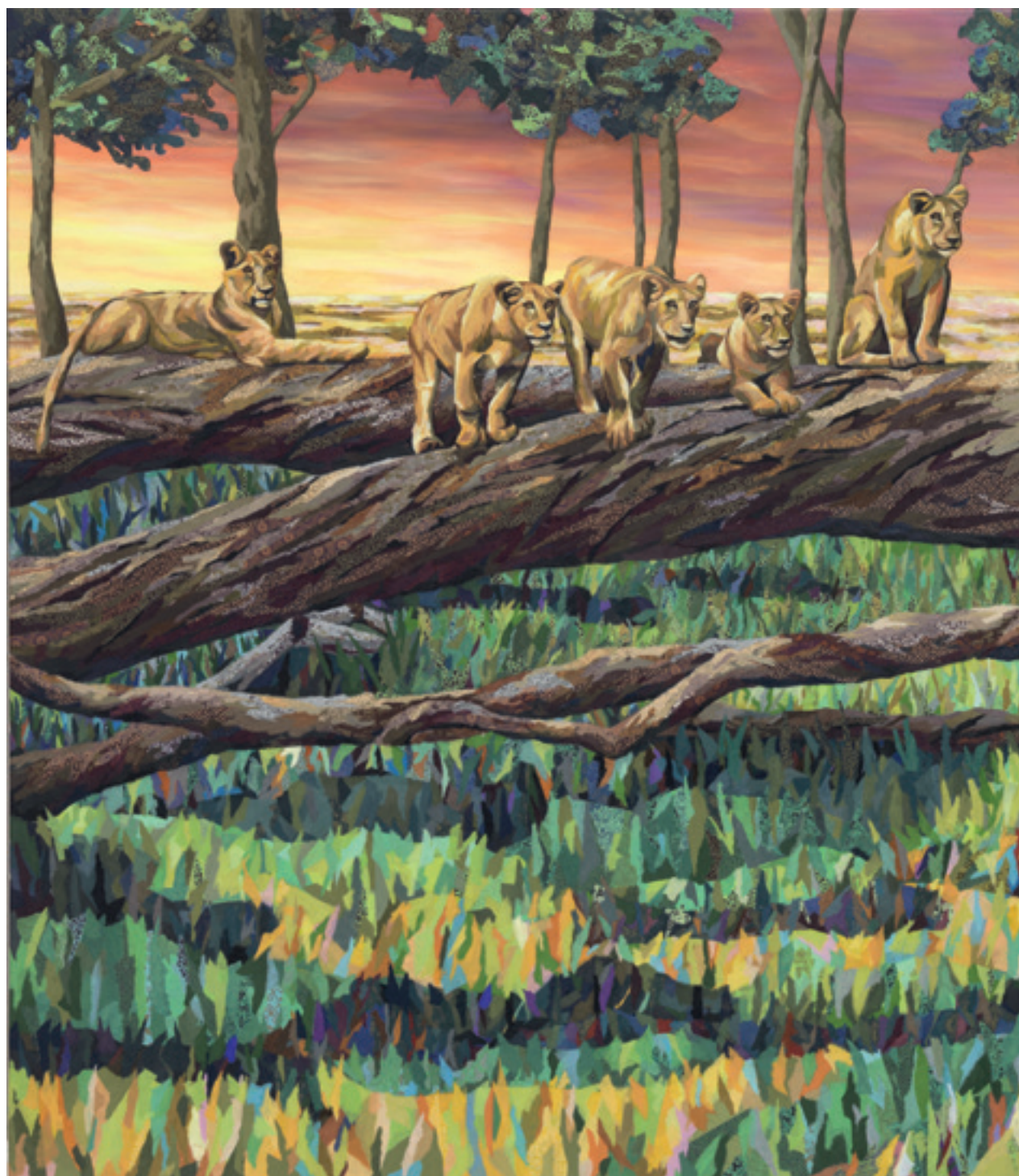
Neugierige Welt, 2012, Acryl, Papiercollage auf Leinwand, 150 x 300 cm

Die koreanische Künstlerin SEO ist eine Wanderin zwischen den Welten. Künstlerisch und privat. Seo Soo-Kyoung, die die Initialen ihres bürgerlichen Namens zur Marke SEO kondensiert hat, hat seit den Anfängen ihres künstlerischen Schaffens eine atemberaubende Reise aus den traditionellen koreanisch-chinesischen Bilderwelten in die abstrakten Sphären des Westens angetreten. Und sie pendelt intellektuell noch immer zwischen den unterschiedlichen Kulturen von West und Ost, stets auf der Suche nach einer universellen Kunstsprache, die in einer globalisierten Welt die Rolle eines Vermittlers einnehmen könnte. SEO, eine Meisterschülerin von Georg Baselitz, des großen charismatischen Malers der Tabubrüche, stellt vom 30. Juli bis zum 6. September erstmals in der Augsburg-